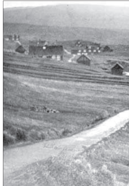
Gomul mynd av Argjum.