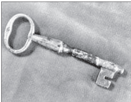
Lykil frá Argjahospitali.