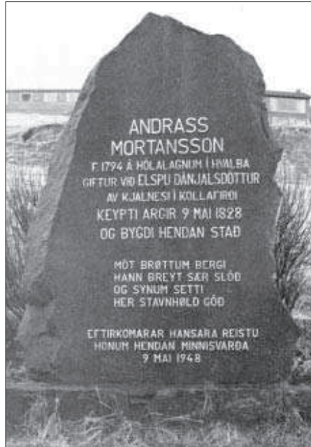
Minningarsteinurin fyri fyrsta argjamannin.

Í byrjanini var onki ravnagn í skúlanum. Tað kom ikki fyrr enn í 1954. Tað tók umleið eitt ár til húsinu á Argjum fingi el og gøtuljosið kom. Við hesi broyting komu so allir hentleikar. Í staðin fyri at fara suður í krónna suður á Glyvurnesi eftir torvi, fingi vit el-krónna inn í køkin.